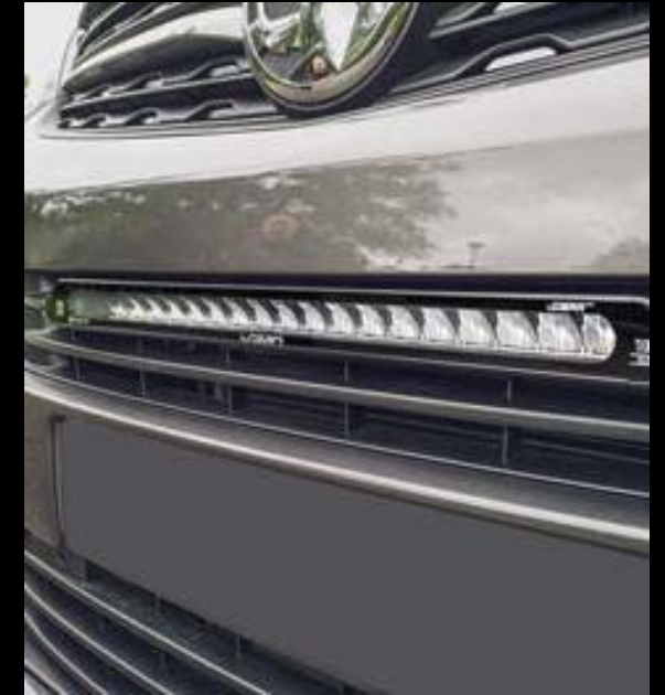
EXTERIÖR STYLING / EXTRALJUS