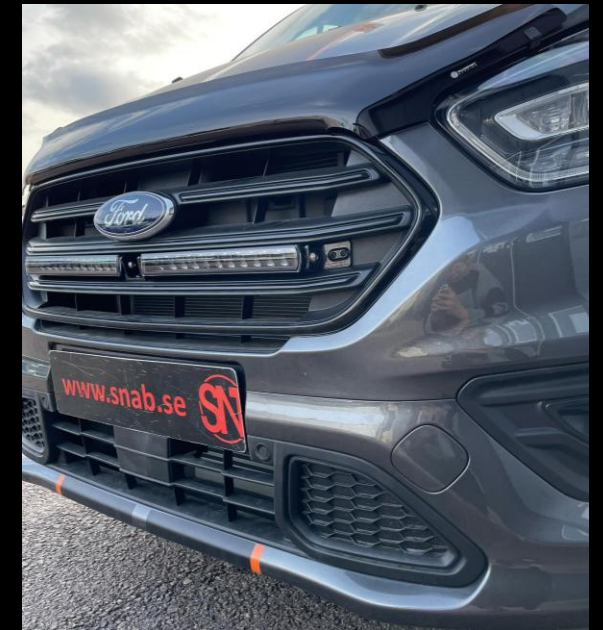
EXTERIÖR STYLING / EXTRALJUS