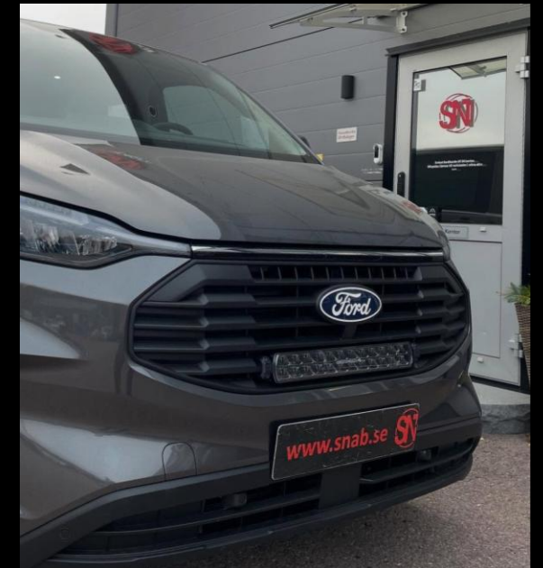
EXTERIÖR STYLING / EXTRALJUS