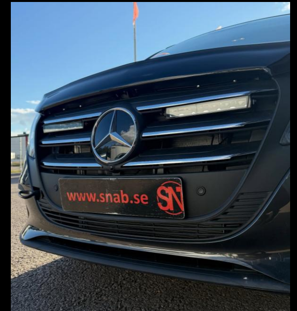
EXTERIÖR STYLING / EXTRALJUS