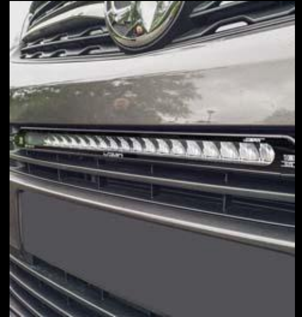
EXTERIÖR STYLING / EXTRALJUS