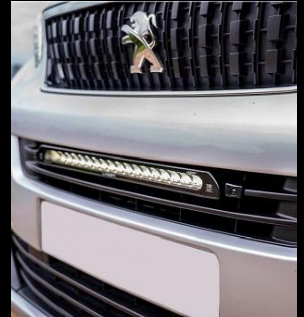
EXTERIÖR STYLING / EXTRALJUS