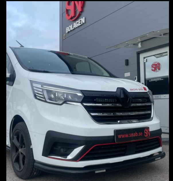
EXTERIÖR STYLING / EXTRALJUS