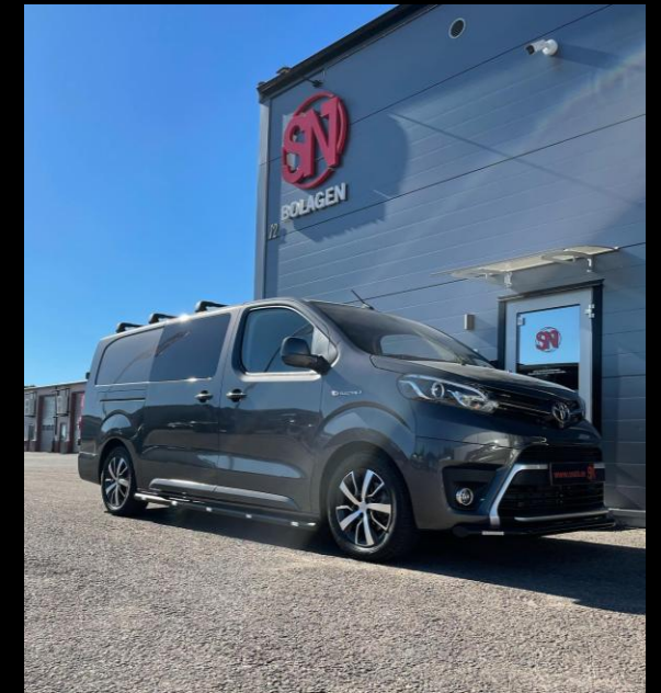
EXTERIÖR STYLING / EXTRALJUS