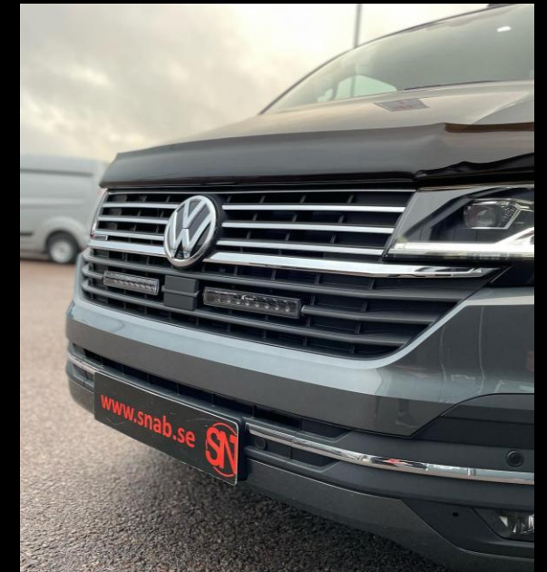
EXTERIÖR STYLING / EXTRALJUS