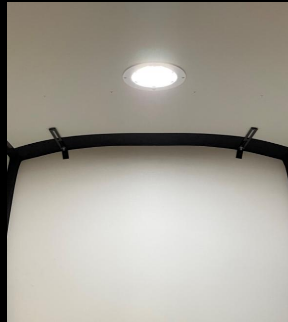
INFÄLLD LED-BELYSNING LASTUTRYMME