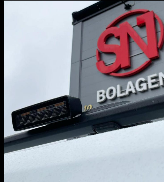
ARBETSLJUS / BLIXTLJUS