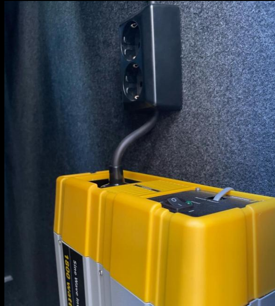
OLIKA LÖSNINGAR AV ELSYSTEM