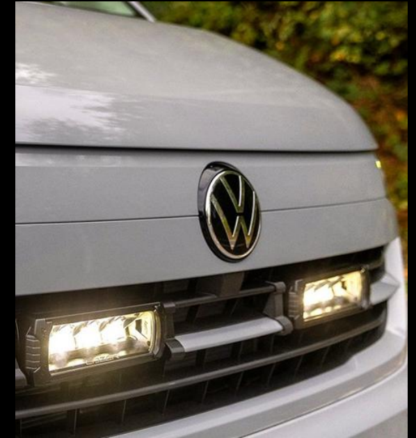
EXTERIÖR STYLING / EXTRALJUS