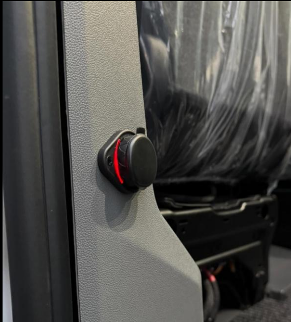
USB ELLER 12V-UTTAG