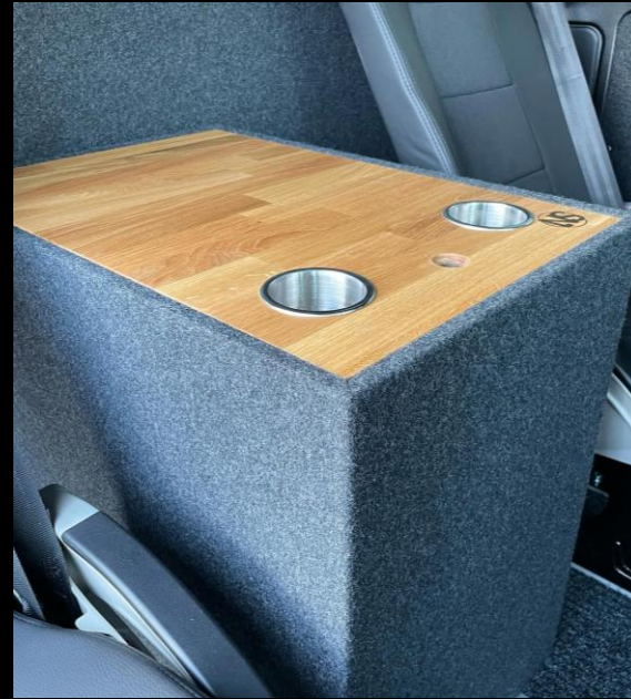
SN BORD LOUNGE