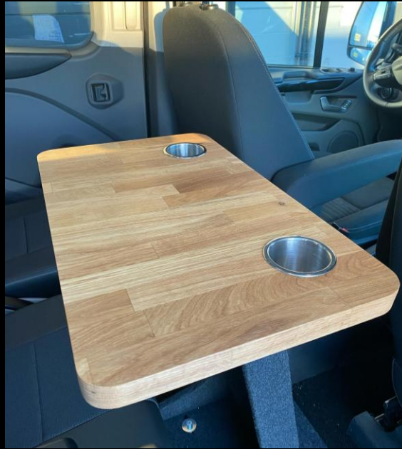
SN BORD PLAIN