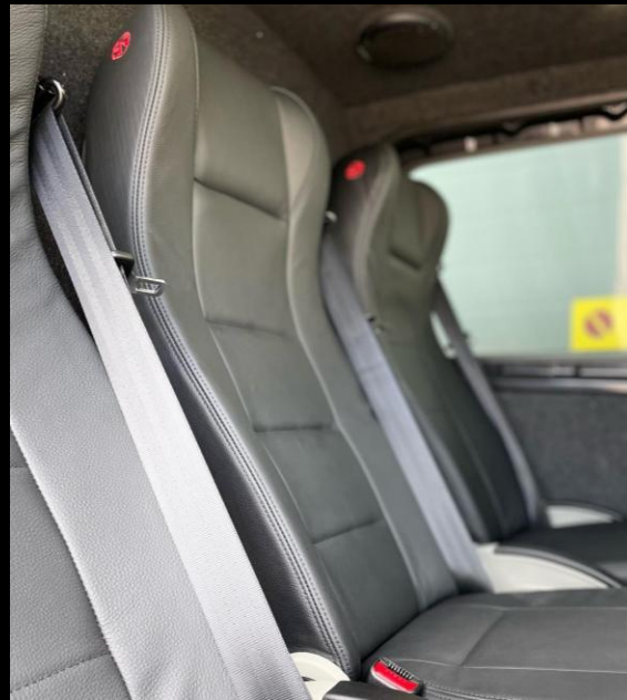
OLIKA KLÄDSELALTERNATIV MED/UTAN ISOFIX